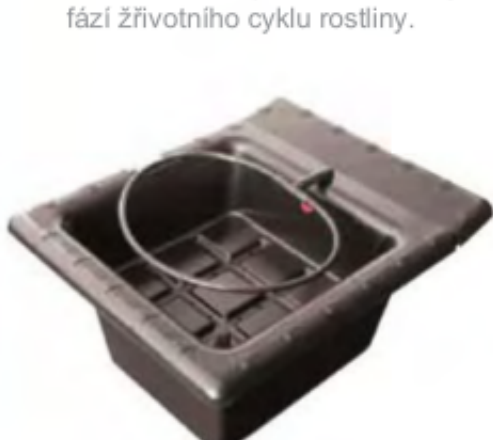
Flo-Gro Sedodává VE 3 Velikostech